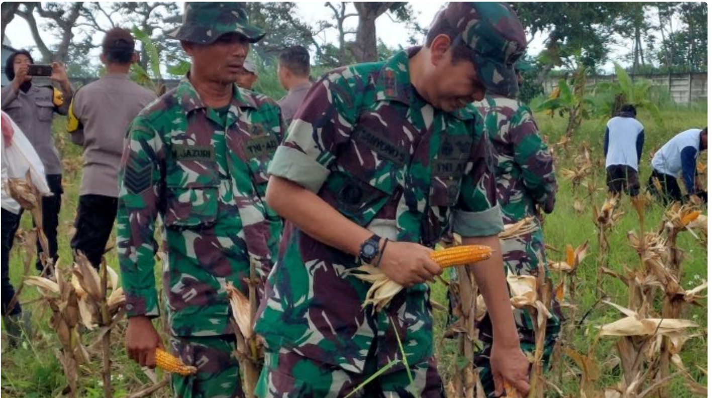
Wujudkan Ketahanan Pangan Bersama TNI AD, Lapas Terbuka Kendal Panen Jagung Bersama

KENDAL – Sinergi dengan TNI AD dalam hal ini Koramil 02/Patebon, Lapas Terbuka Kendal wujudkan program ketahanan pangan dengan melaksanakan budidaya jagung pada lahan seluas 3500m 2 . Bentuk keberhasilan dalam program ini, Lapas Terbuka Kendal bersama jajaran Koramil 02/Patebon panen jagung bersama pada Rabu (22/02/2023).