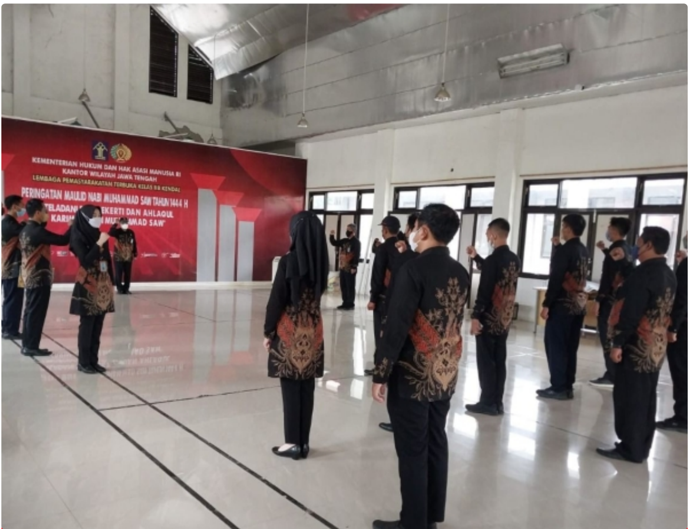
Kasubbag TU Sampaikan ASN Lapas Terbuka Kendal Harus Jadi ASN Unggul

KENDAL – Dalam mempertahankan kedisiplinan dan membangun rasa kebersamaan diperlukan upaya yang dilakukan secara kontinu. Apel pagi menjadi salah satu rutinitas yang dilakukan ASN Lapas Terbuka Kendal sebagai upaya menjaga kedisiplinan dan memupuk rasa kebersamaan, Sabtu